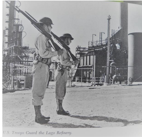
U.S. Troops Guard the Lago Refinery.

Aki un bes mas mi kier ilustra con hopi un isla chikito manera di nos, na dos ocasion, a contribui pa yuda e aliadonan gana e guerra. Nos tur por corda con Lago tabata suministra for di cada 16 galon di e gasolin di aviacion di 100 octano cu e aliadonan tabata usa, uno tabata bay for di e refinaria